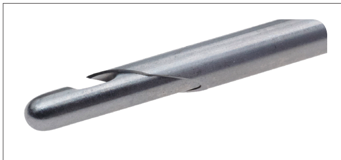
Spidsen af veress kanyle